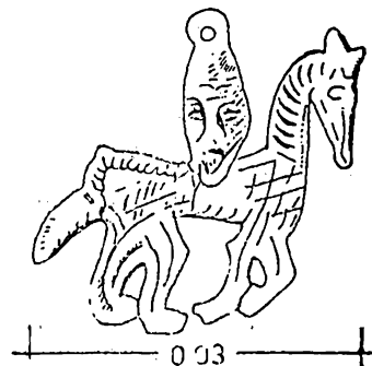
Fig. 2. Amuletă antropo-zoomorfă.

Tehnica de lucru și dimensiunile identice la cele mai multe din aceste amulete, în ciuda poziției ușor modificate a cailor și a varietății hașurilor de pe suprafața unora dintre ele, arată că asemenea piese au fost produse inițial într-un singur centru și, ulterior, copiate cu mici modificări. Este intere-