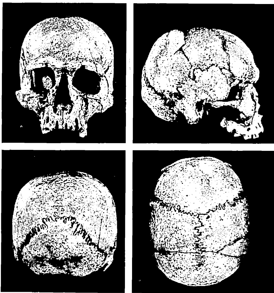
Fig. 1. — Craniul scheletului de la Erbiceni.

Forma generală a craniului este aceea a unui ovoid scurt în normă verticală și sferoidală, în normă occipitală. Indicele cefalic este sub-brachicran , foarte aproape de limita categoriei mezocrane. El corespunde unui diametru longitudinal mijlociu spre scurt și unui diametru transversal mijlociu spre îngust. Înălțimea basilo-