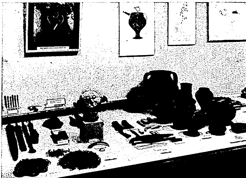
Fig. 3. — Detaliu din sala a IV-a. În mijlocul vitrinei capul modelat în piatră al unei divinități celtice de la Mšecké Žehrovice din Boemia.

vase de lut ars, pictate uneori cu motive geometrice. Și în perioada următoare, de tranziție de la Hallstatt la La Tène (mijlocul mileniului I î.e.n.), se întâlnesc asemenea morminte tumulare bogate, cu numeroase obiecte de lux de o deosebită importanță științifică și muzeistică, ca de exemplu diademe, brățări și cercei de aur din diferite descoperiri, cana de bronz de proveniență etruscă din mormântul tumular de la Hradiště la Písek, fibula de bronz de la Panenský Týnec, decorată cu motive în formă de pasăre și de om, și alte numeroase obiecte de podoabă, decorate într-un stil deosebit de acela geometric hallstattian.