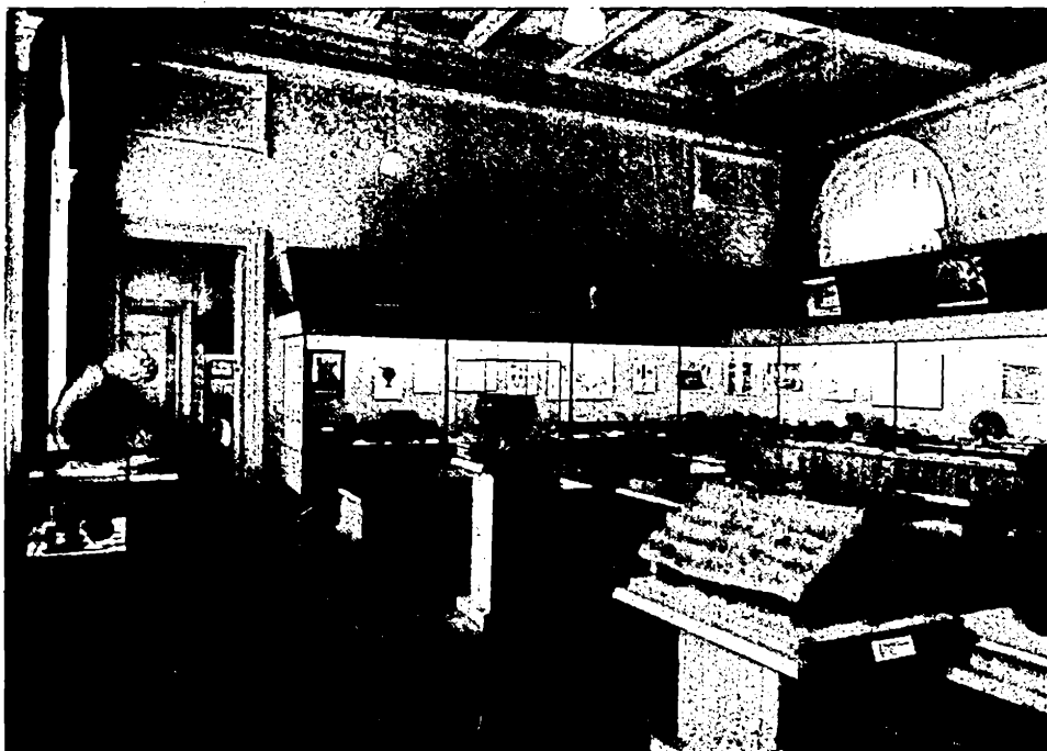
Fig. 2. — Sala a IV-a, cu exponate din epoca La Tène. În stînga și centru materiale arheologice descoperite în Cehoslovacia; în dreapta materiale arheologice din Europa.

mia, Moravia și Slovacia de est și vest din vremea orînduirii comunei primitive, precum și raporturile genetice dintre culturile fiecărei perioade. În acest scop s-au folosit numai planuri orizontale, care uneori sînt însă prea joase pentru a se putea vedea în bune condiții materialele expuse, care de altfel, datorită felului anevoios de deschidere a vitrinelor mari, nu pot fi scoase oricînd din vitrine pentru a fi studiate mai îndeaproape de către specialiști. În genere, prin procedeele muzeistice folosite s-a reușit să se realizeze dinamica principală a expo-