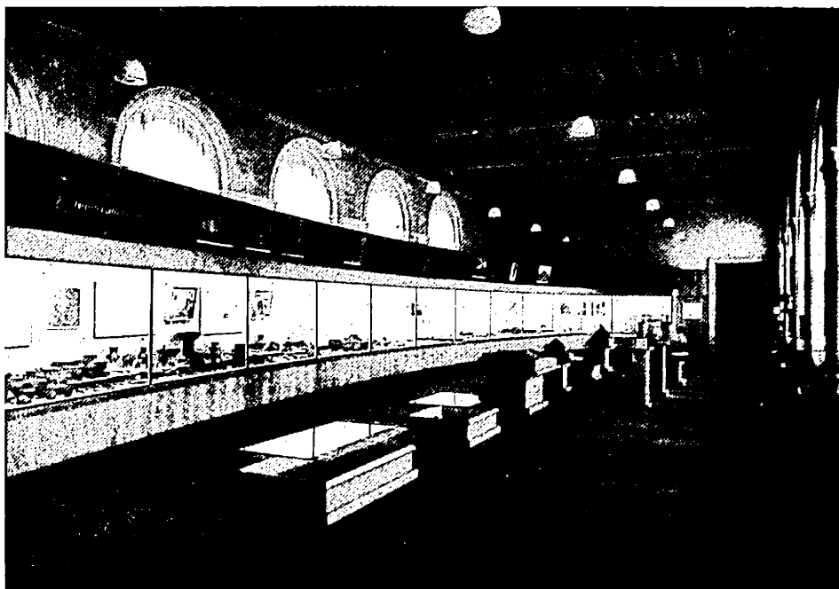
Fig. 1. — Prima sală, cu exponate din paleolitic, mezolitic și neolitic. În stânga și centru materiale arheologice din Cehoslovacia ; în dreapta materiale arheologice din Europa.

Fiecare sală a fost împărțită în trei sectoare : unul, principal, pe dreapta, cu vitrine mari continue pentru exponate originale și material grafic compli-