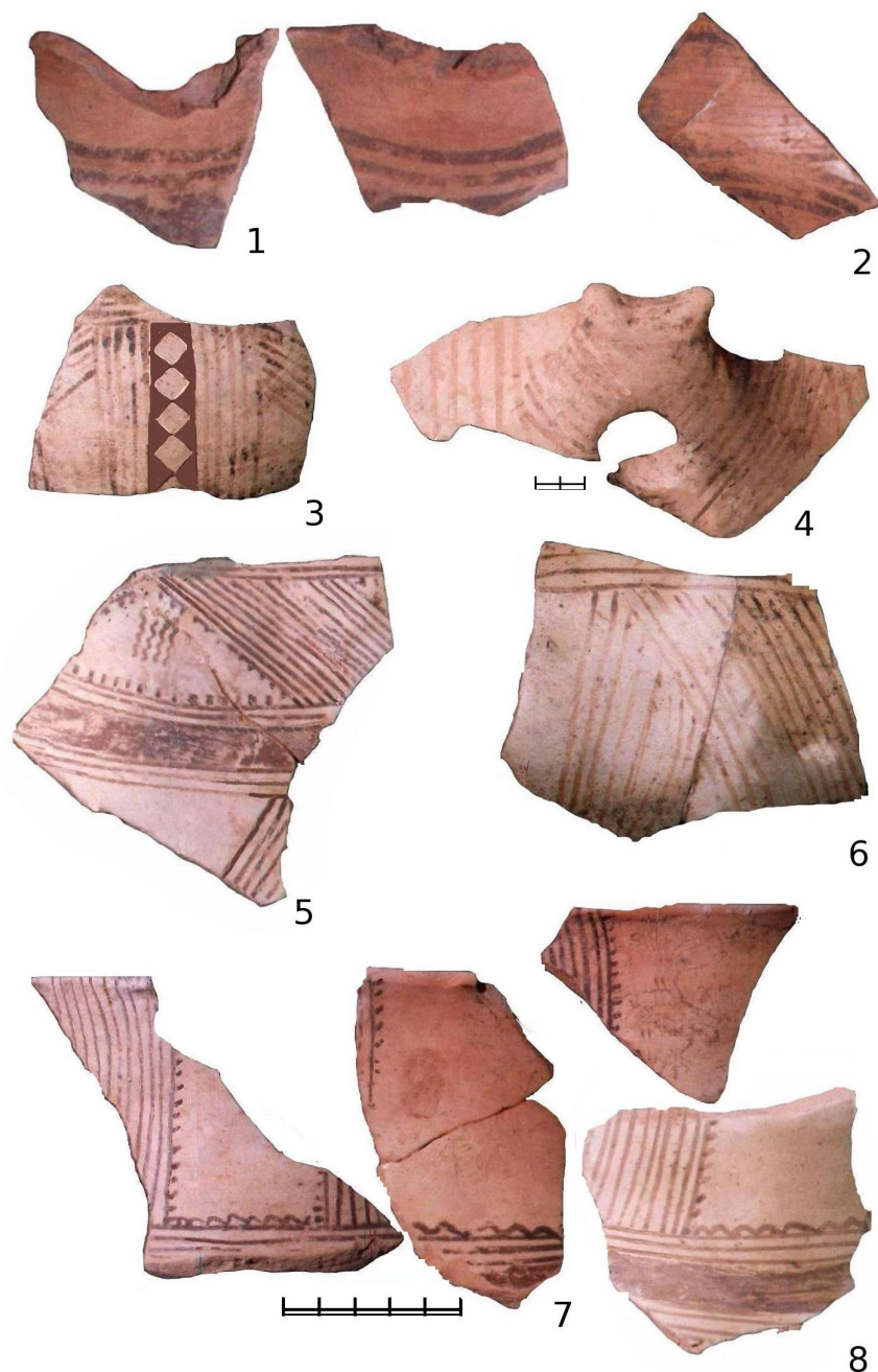
Fig. 1. Trinca-Izvorul lui Luca . 1–8 fragments céramiques peints: 1–2 style \epsilon_{1a} , la civilisation Cucuteni; 3, 5, 7–8 style \zeta ; 4, 6, style Gordinești, le groupe culturel Horodiștea/ Erbiceni-Gordinești.

L'éclaircissement du phénomène de transition de la civilisation Cucuteni-Tripolie avec ses communautés d'agriculteurs précoces, au groupe culturel Horodiștea / Erbiceni-Gordinești avec des communautés mixtes, est renforcé aussi par le changement du style pictural de la céramique conservée dans les complexes des habitats datés dans ces séquences culturelles, parmi lesquelles trouve aussi sa place Trinca-Izvorul lui Luca .