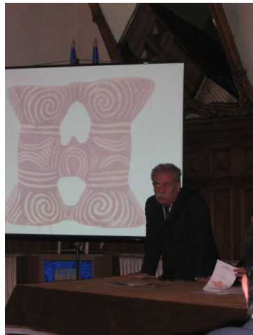
Botoșani, 27.11.2004 (deschiderea expoziției Cucuteni la Muzeul Județean Botoșani)