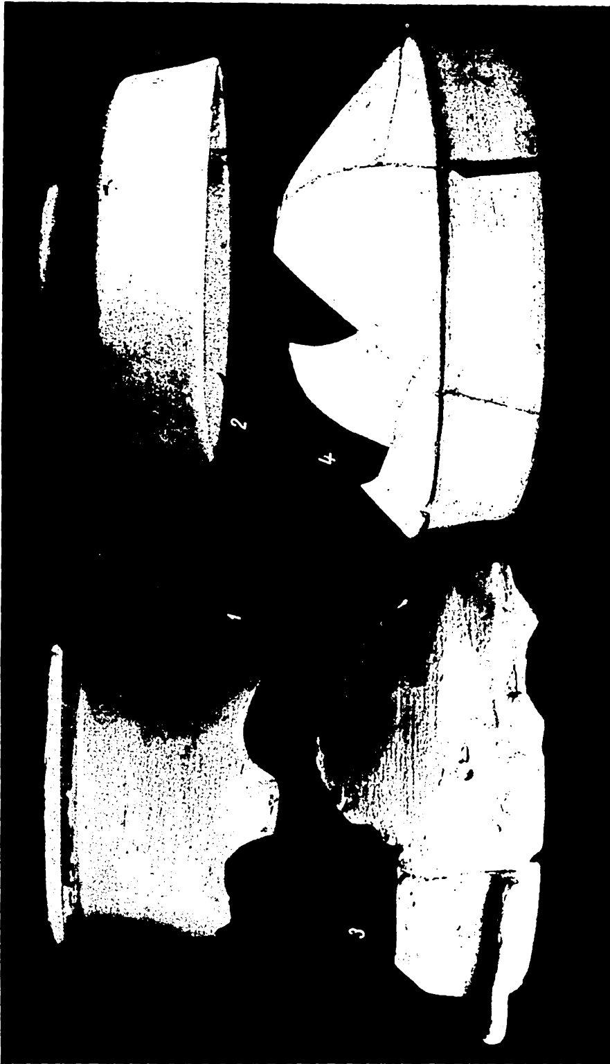
Fig. 2. — Vase lucerne la roată (1 = 1/3 m. nat.; 2 = 1/2 m. nat.; 3 = 3/5 m. nat.; 4 = 2/5 m. nat.).