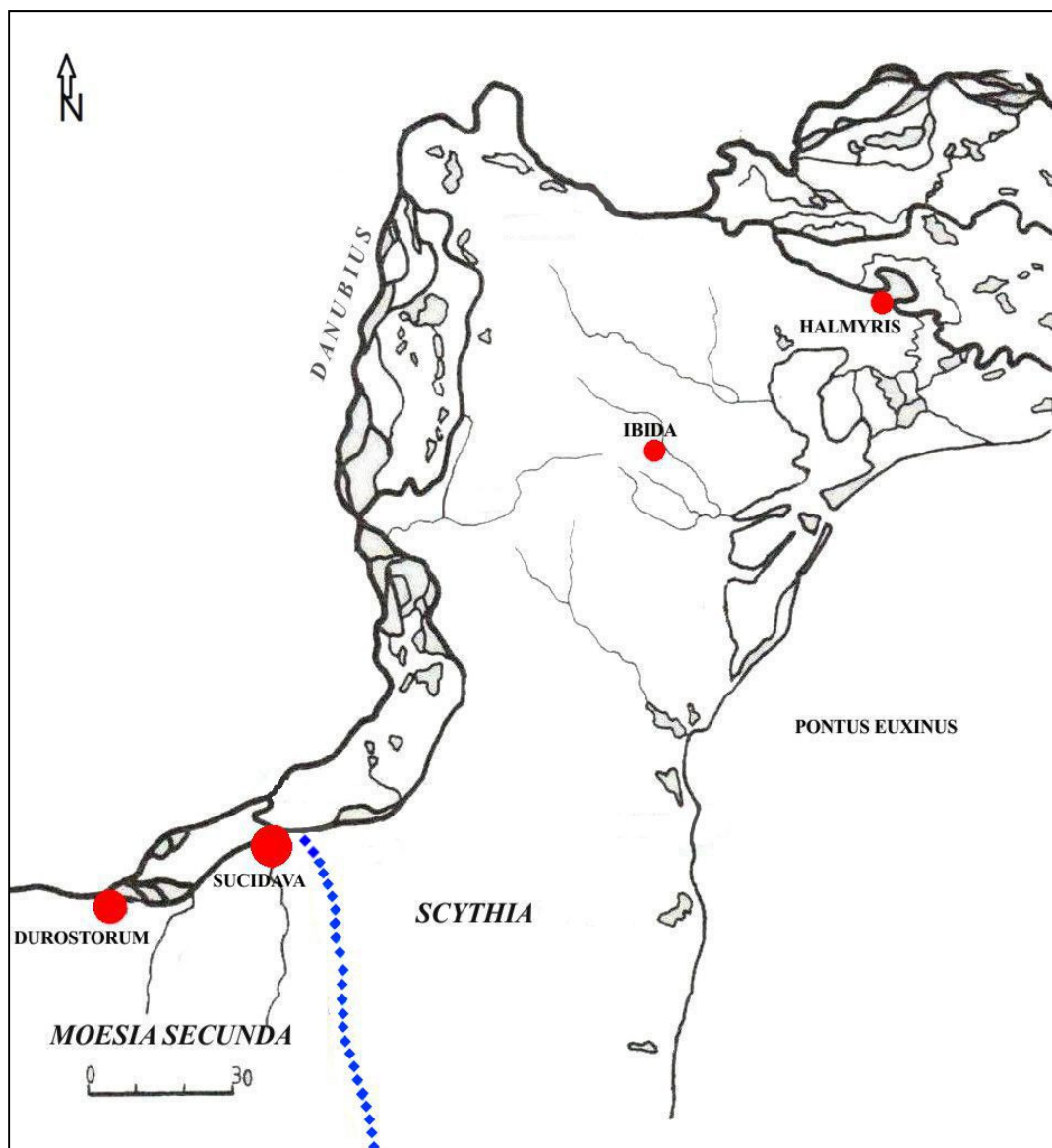
Pl. II. Harta situilor din Dobrogea cu sigilii comerciale civice și provinciale.